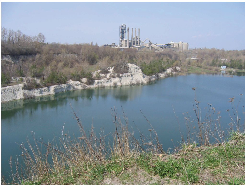
Kamieniołom Odra I w Opolu – ostoja fauny wodno-błotnej o znaczeniu regionalnym.