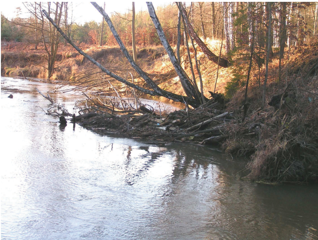
Koryto Małej Panwi z charakterystycznymi podcięciami erozyjnymi – geostanowisko rangi regionalnej – część projektowanego PK Doliny Małej Panwi w obrębie proponowanego rezerwatu.