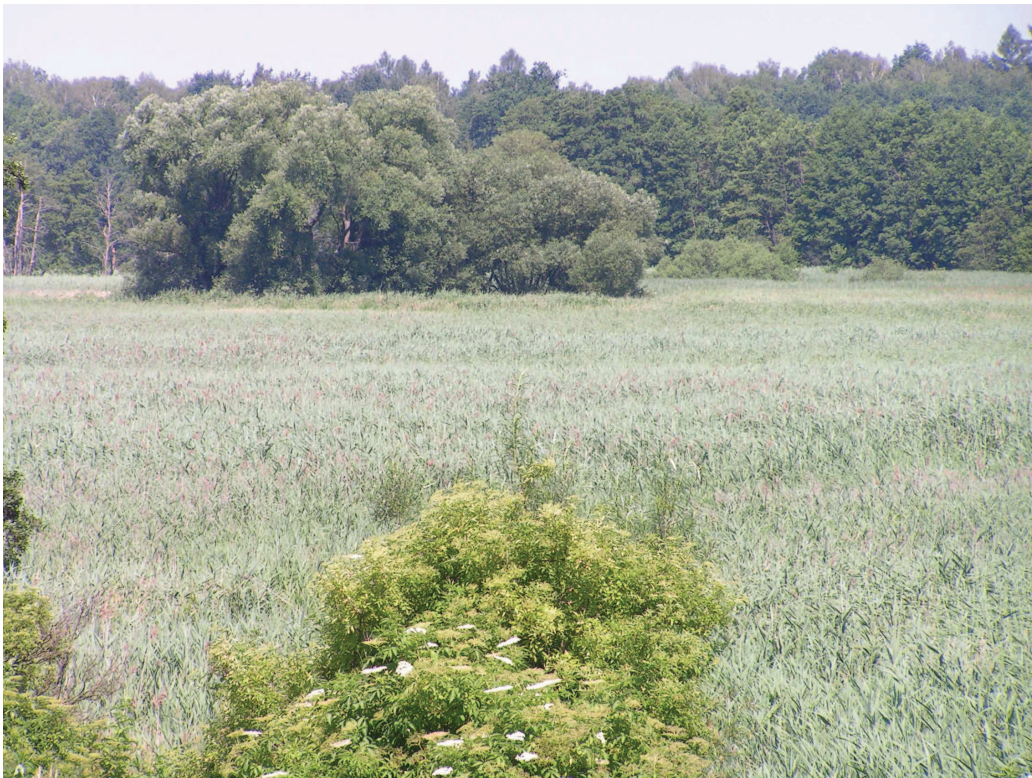
Duże obszary z dominacją zbiorowisk szuwaru trzcinowego – coraz radsze zbiorowiska dolin rzecznych – dolina Widawy.