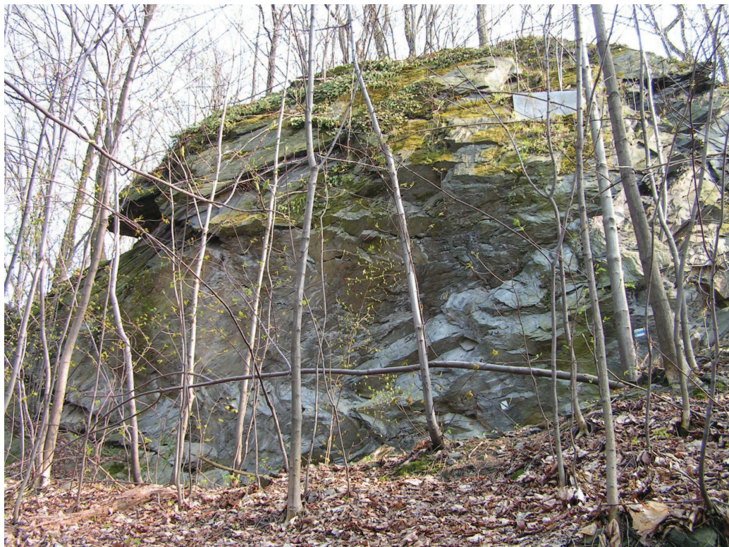
Naturalne wychodnie szarogłazów i łupków fyllitowych warstw andelskohorskich w Jarnołtówku (Góry Opawskie).