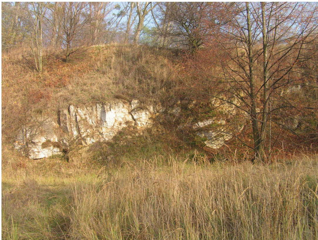
Zarastające odsłonięcia skalne wapieni w rezerwacie Góra św. Anny.