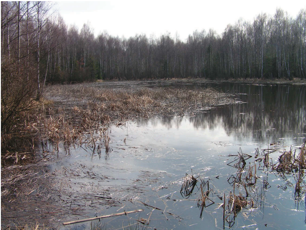
Zbiorowiska starorzeczy w dolinie Małej Panwi koło Kolonowskiego. – siedlisko chronione.