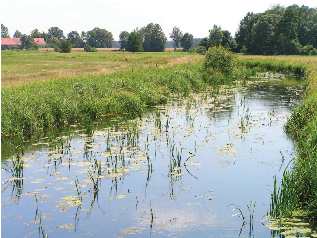
Korytarz ekologiczny doliny Widawy – jeden z ważniejszych w północnej części regionu. Projektowany obszar chronionego krajobrazu.