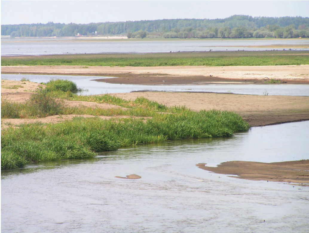
Jeden z najrzadszych typów krajobrazów naturalnych województwa – krajobraz delt rzecznych – ujście Małej Panwi do Zbiornika Turawskiego, w tle ujście Libawy projektowany rezerwat.