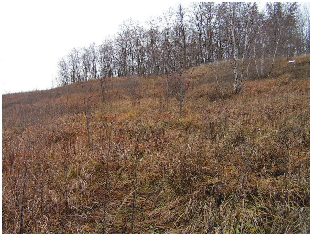
Zarastające murawy kserotermiczne w rezerwacie Góra Gipsowa.