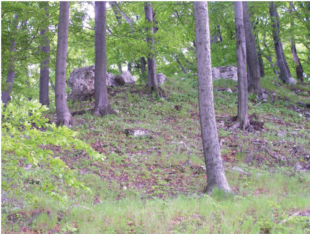
Fragment jednego z rzadszych typów krajobrazów naturalnych – zwartych masywów ze skałkami na Garbie Chełmu – Góra Biesiec.