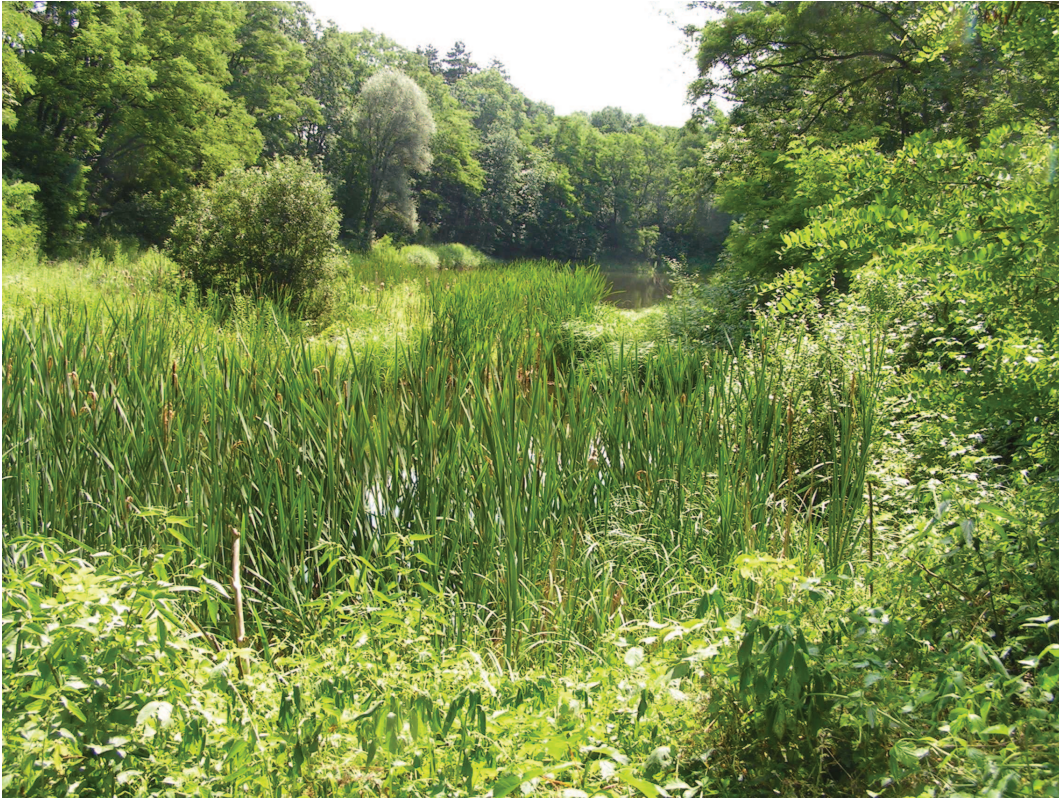
Uroczysko zróżnicowanych gatunkowo biocenoz w korytarzu ekologicznym rangi krajowej doliny Proсны – projektowany obszar chronionego krajobrazu. Fot. K. Badora.