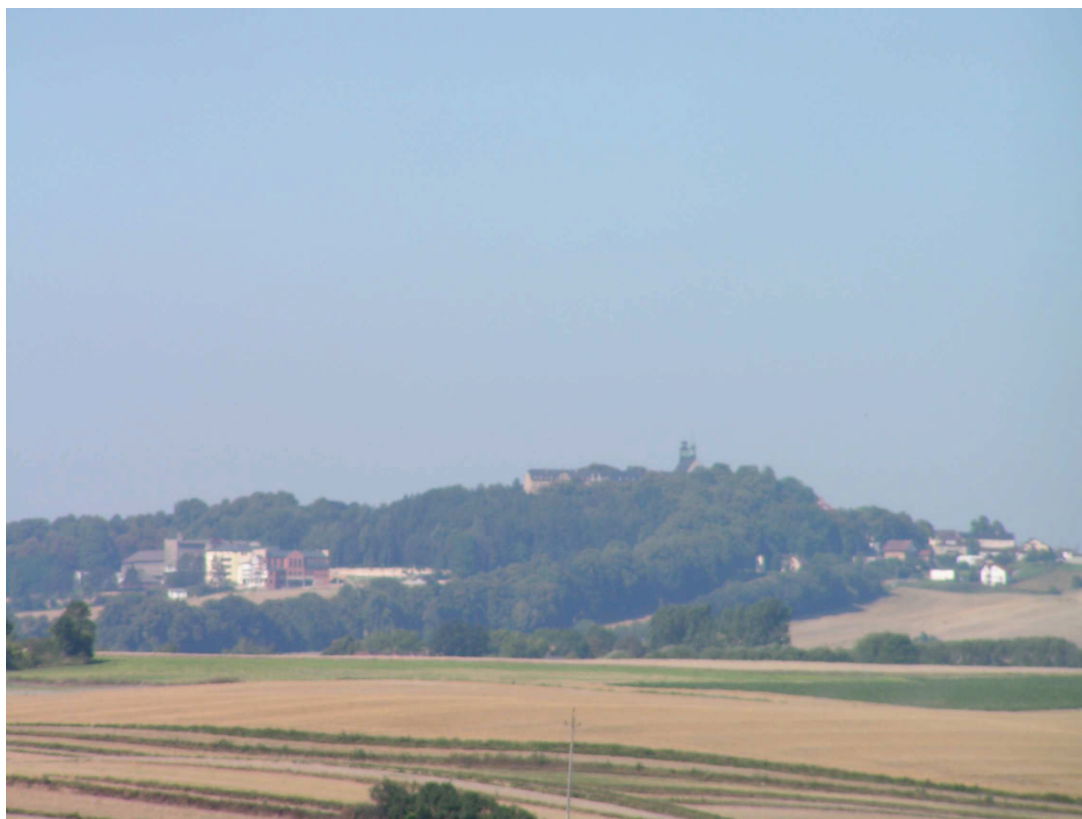
Widok na kulminację Chełmu w PK Góra św. Anny.