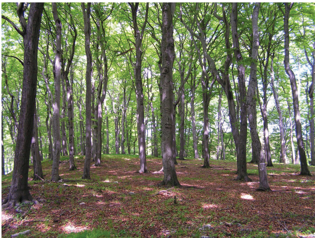
Buczyny w rezerwacie Biesiec.