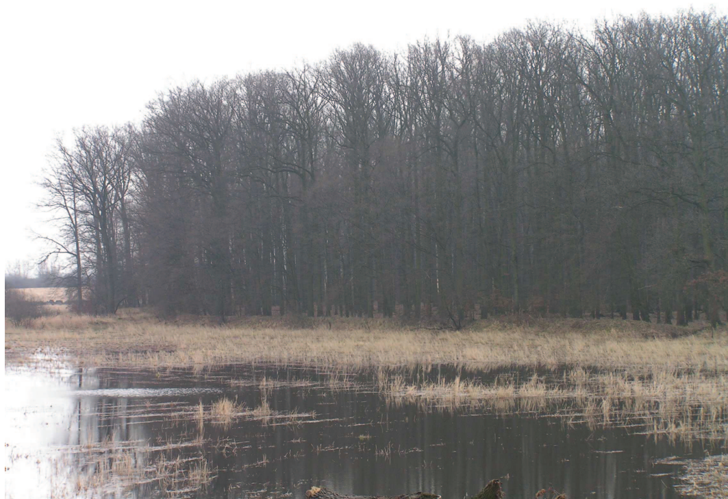
Jedne z najniżej położonych obszarów województwa – dolina Odry na wysokości Brzegu – cenny fragment krajobrazów wodno-błotnych o dużych walorach przyrodniczo-krajobrazowych i niewielkich gospodarczych, chroniony w Stobrawskim PK.