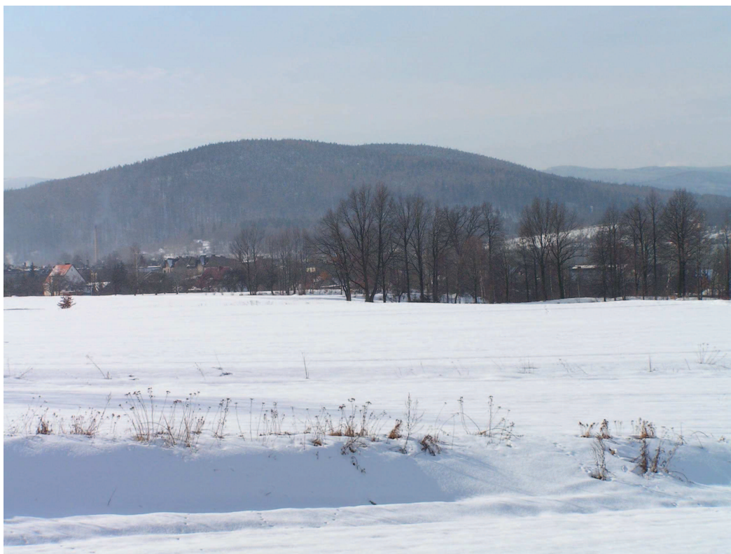
Jedno z najwyższych wzniesień województwa opolskiego – Góra Chrobrego w Gluchołazach. Obszar bardzo wysokich walorów przyrodniczo-krajobrazowych, chroniony w PK Góry Opawskie.