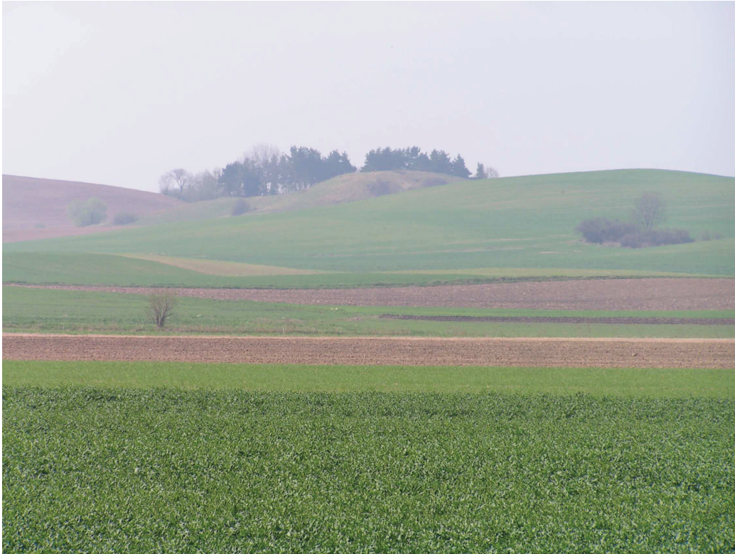
Strefa sandrów marginalnych w obrębie Wzgórz Otmuchowsko-Nyskich – geostanowisko rangi ponadregionalnej – projektowane poszerzenie ochrony Otmuchowsko-Nyskiego OCHK.