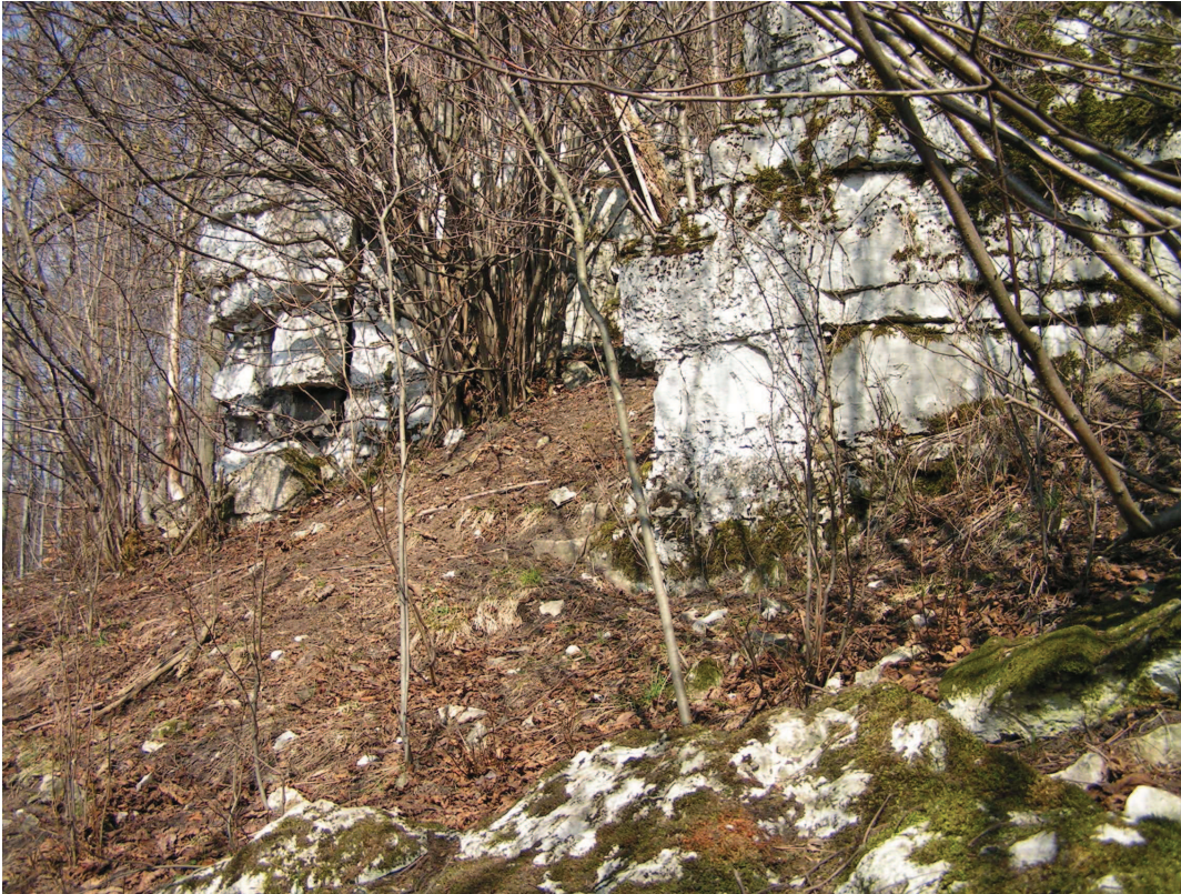
Naturalne odsłonięcia skalne wapieni z wyraźnym progowym charakterem rzeźby na Górze Szpica – projektowany rezerwat przyrody i obszar projektowanego powiększenia PK Góra św. Anny.