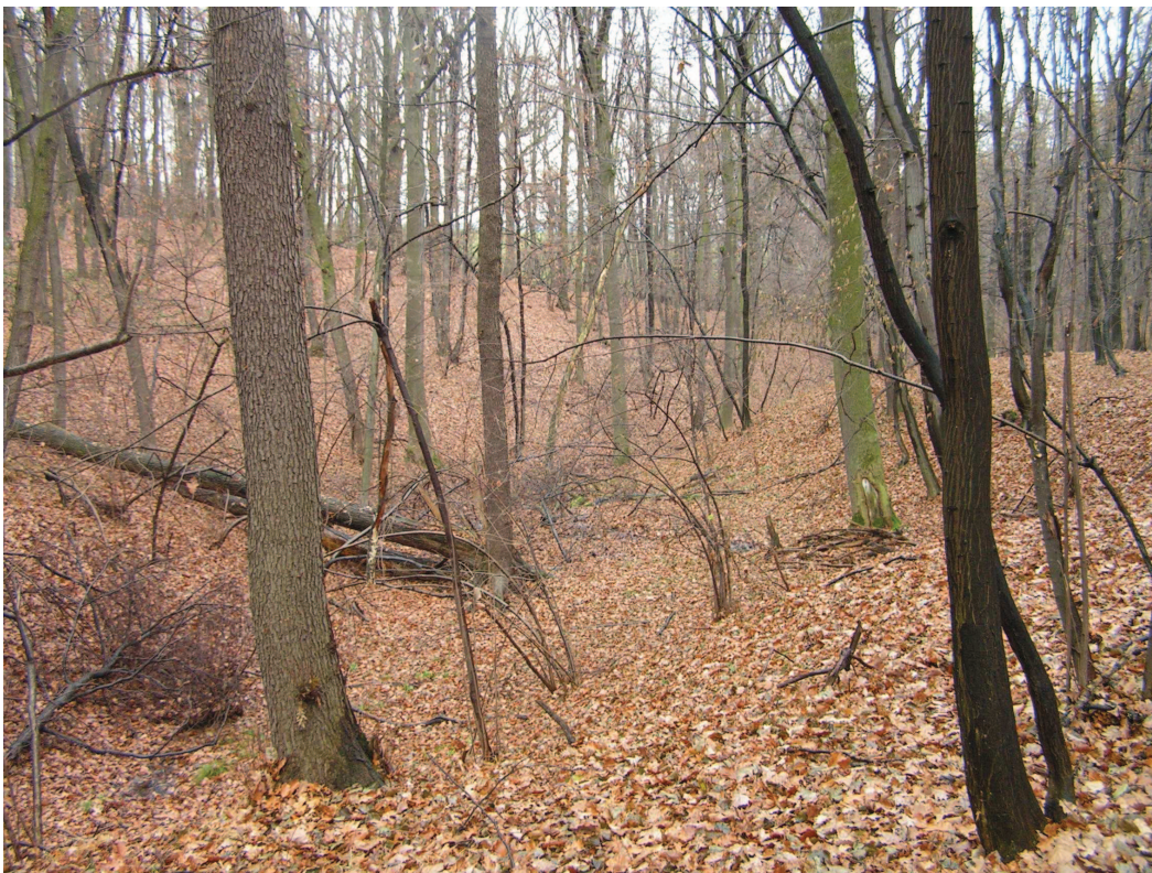
Kompleks leśny w Rozumicach – jedno z ważniejszych ostoi florystycznych regionu zlokalizowane w Bramie Morawskiej.