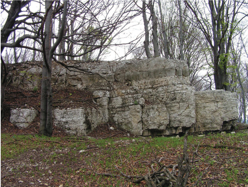
Naturalne wychodnie wapieni warstw górazdzańskich koło Ligoty Dolnej na Garbie Chelmu – jedno z ciekawszych geostanowisk środkowotriasowych Opolszczyzny.