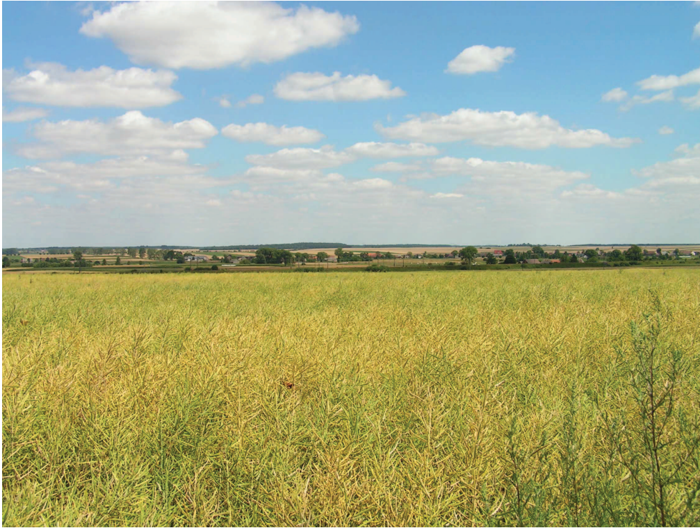
Wieloprzestrzenne obszary z dominacją zbiorowisk pospolitych chwastów polnych – dominujące obszarowo zbiorowiska Opolszczyzny – okolica Wilkowa.