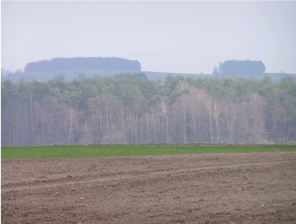
Krajobrazy Wyżyny Woźnicko-Wieluńskiej z charakterystycznym progami strukturalnymi – widok na jeden z nich w okolicach Skrońska.