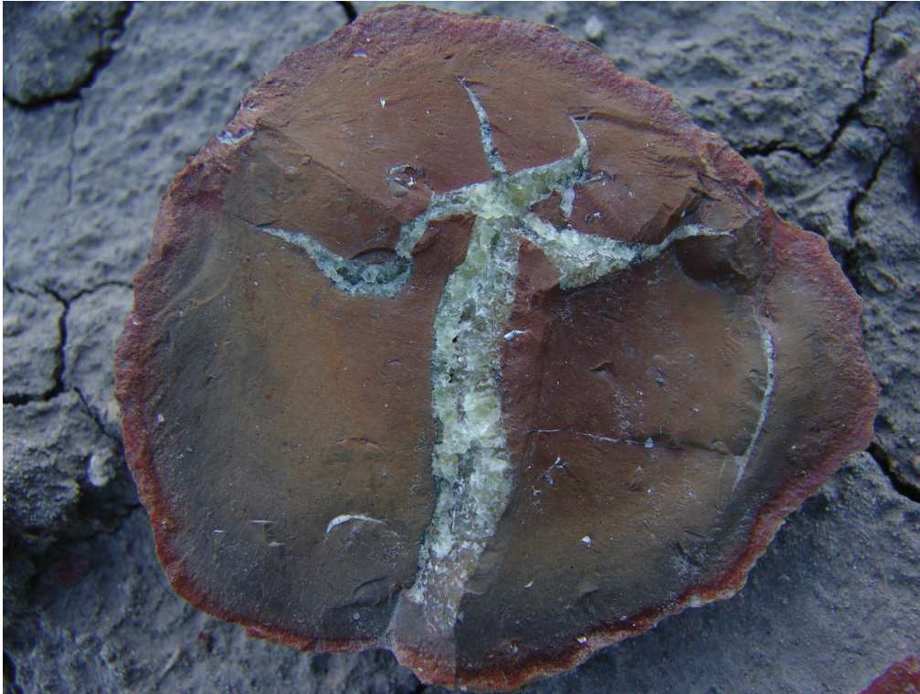
Odcisk jurajskiego jamochłona w sferosyderytach wśród szarych ilów cegielni w Faustiance – geostanowisko rangi krajowej.