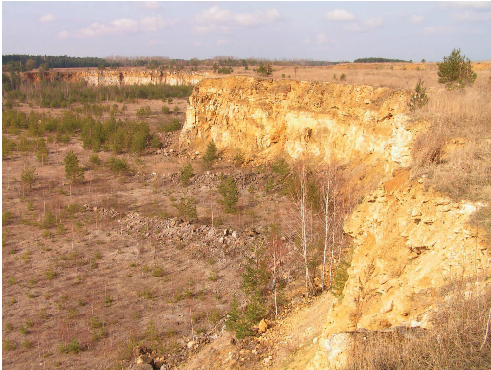
Kamieniołom wapieni środkowotriasowych w Otmicach – geostanowisko o randze regionalnej.