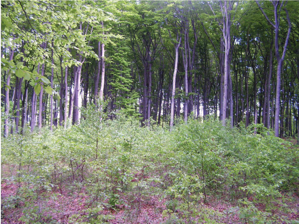
Buczyna na Garbie Chełmu z odsłoniętym gniazdem celem promowania odnowień – jedno z cenniejszych zbiorowisk roślinnych w regionie.