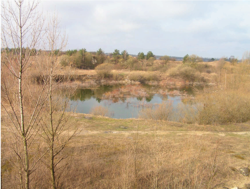
Kamieniołom w Szymiszowie – antropogeniczna ostoja florystyczna.