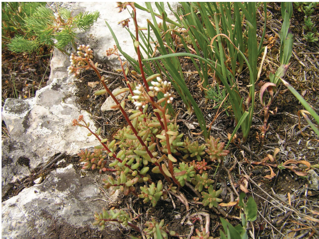
Pozostałości roślinności naskalnej w rezerwacie Ligota Dolna – rzadki i zagrożony typ roślinności Opolszczyzny.