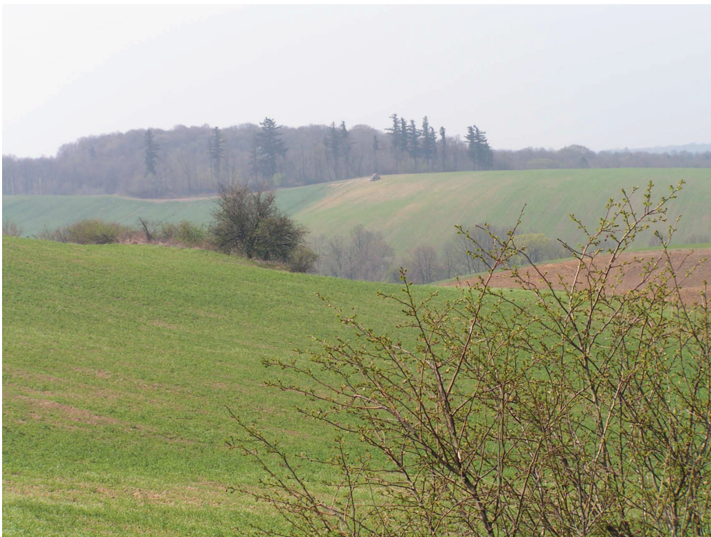
Krajobrazy Wzgórz Niemczańsko-Strzelińskich koło Kamiennika. Jeden z najmniej docenianych obszarów z bardzo cennymi walorami krajobrazowymi – projektowane powiększenie Otmuchowsko-Nyskiego OCHK.