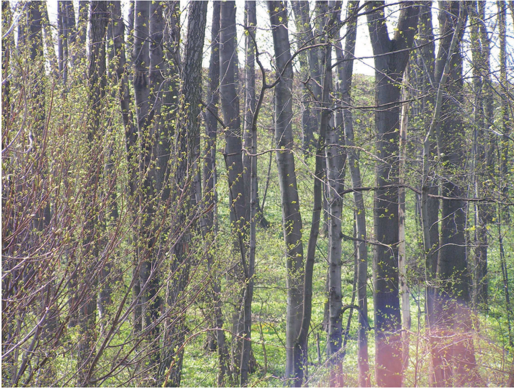
Grąd na stokach rozcięcia erozyjnego jednego z potoków w obrębie Wzgórz Niemczańsko-Strzelińskich – przykład zgodności roślinności naturalnej i potencjalnej.