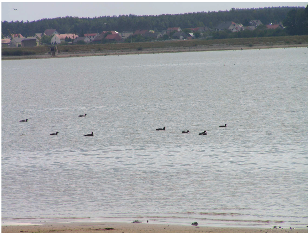
Zbiornik Turawski – ostoja fauny wodno-błotnej o znaczeniu międzynarodowym.