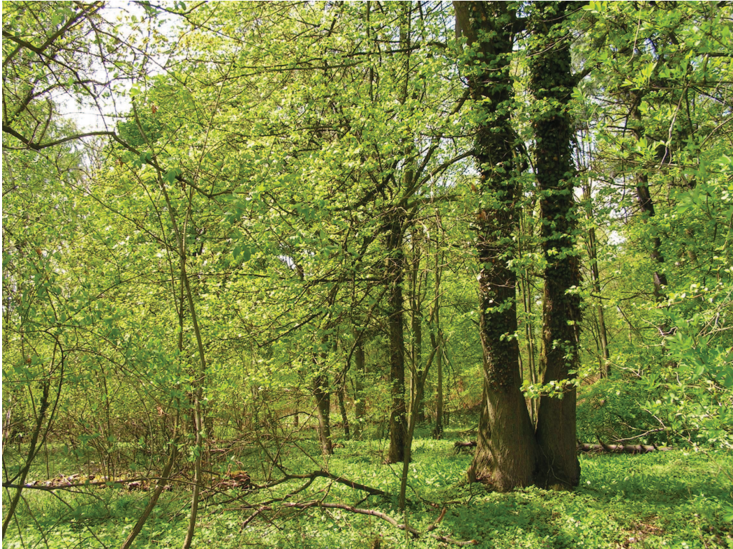
Wilgotne łąki w dolinie Odry koło Rybnej – jeden z najważniejszych obszarów występowania tych chronionych siedlisk przyrodniczych w regionie.