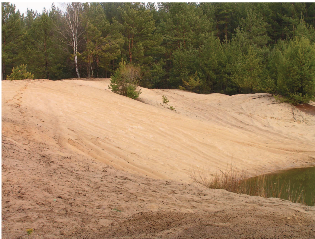
Odslonięcia porośniętych borami wydm w Stobrowskim PK – obszar największej koncentracji terenów wydmych Opolszczyzny.