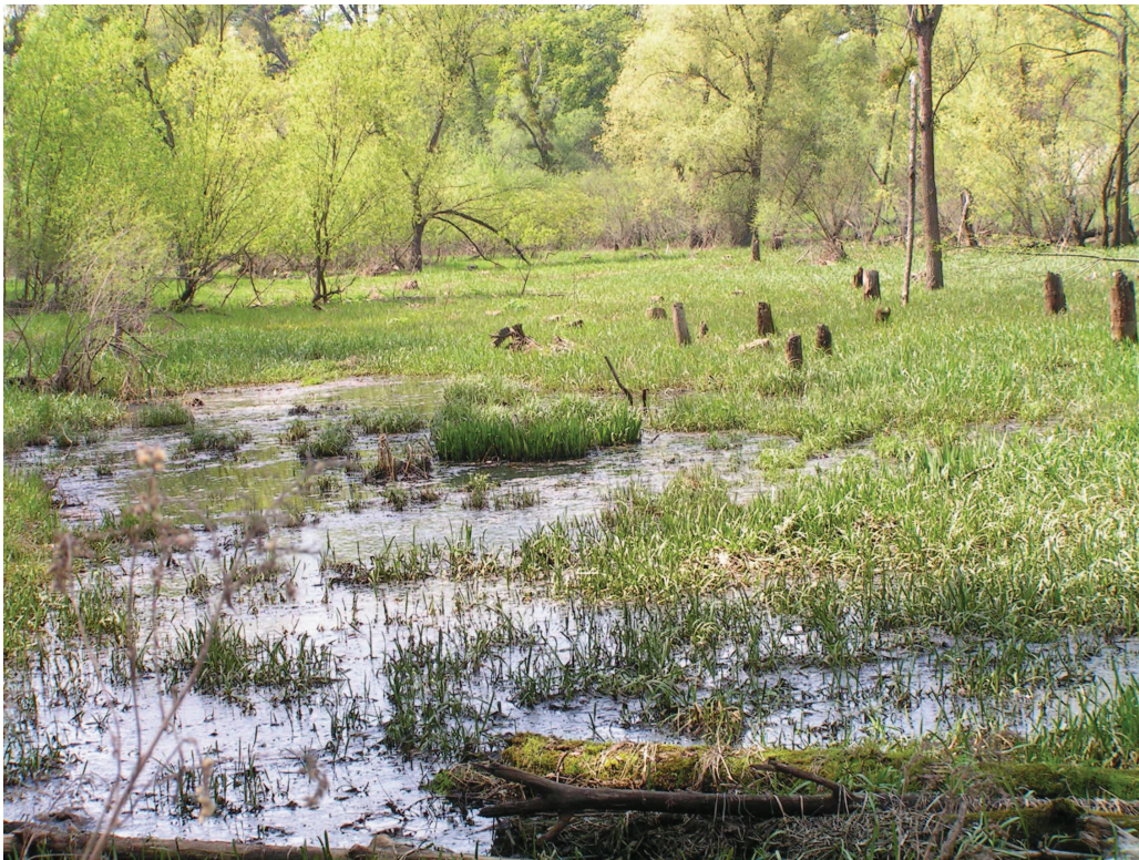
Starorzecze Odry w okolicach Rogowa Opolskiego w stadium zanikania. Zbiorowisko roślinne w niewielkim stopniu odbiegające od potencjalnego.