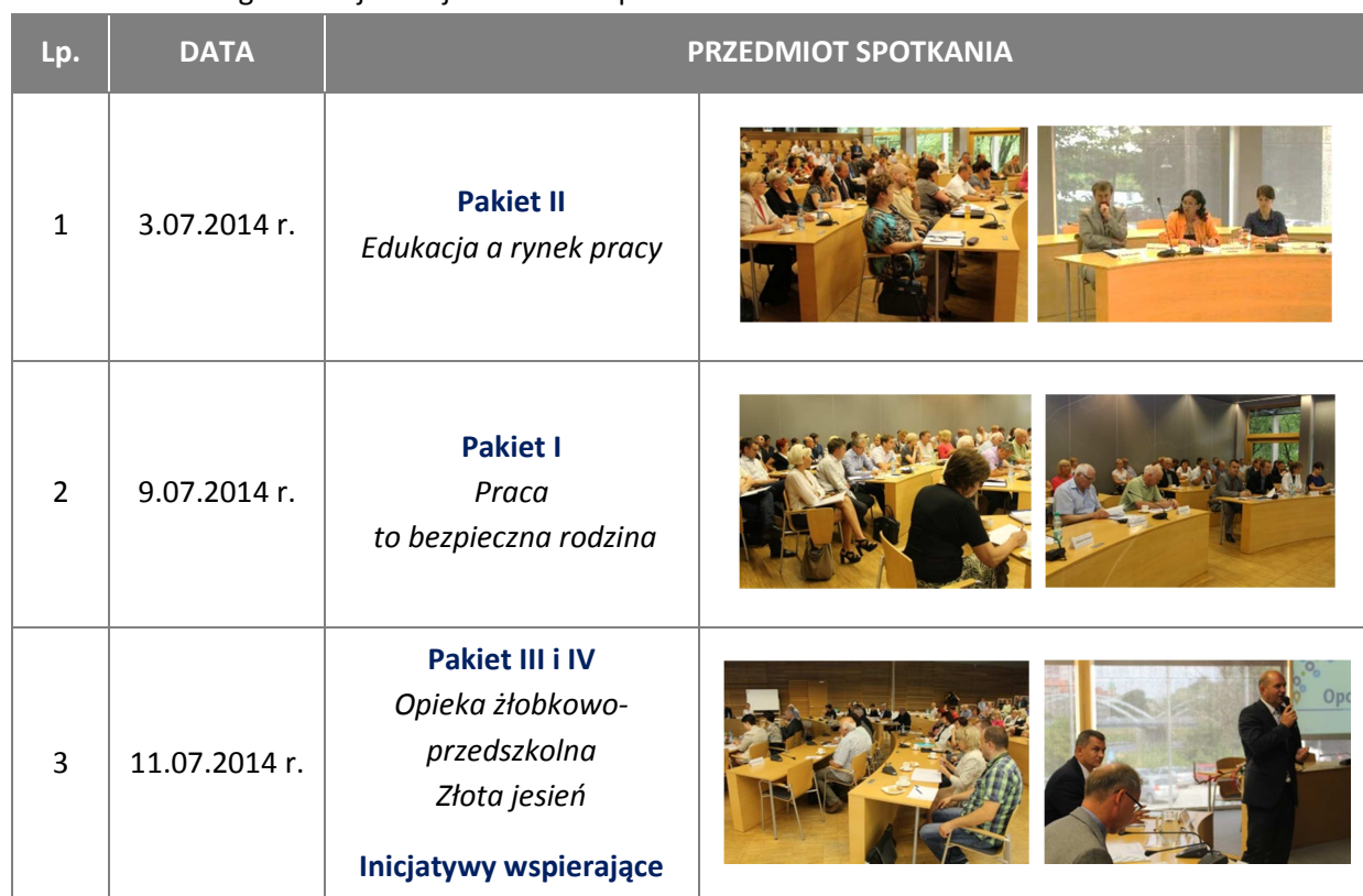
Tabela 1. Zestawienie spotkań w ramach konsultacji społecznych projektu Programu Specjalnej Strefy Demograficznej w województwie opolskim do 2020 r.

Pakiety III - Opieka żłobkowo-przedszkolna i IV - Złota jesień były przedmiotem dyskusji podczas spotkania zorganizowanego 11 lipca 2014 r. Wśród dyskutantów znaleźli się m.in. Wojewoda Opolski, reprezentanci podmiotów działających w sferze szeroko rozumianej ochrony zdrowia i życia ludzkiego, rynku pracy, uczelni wyższych oraz świadczących usługi dla osób starszych.