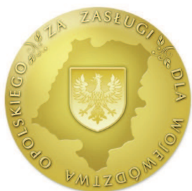
Wersja monochromatyczna skala 1:1