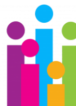
Forum Młodzieży Samorządu Województwa Opolskiego