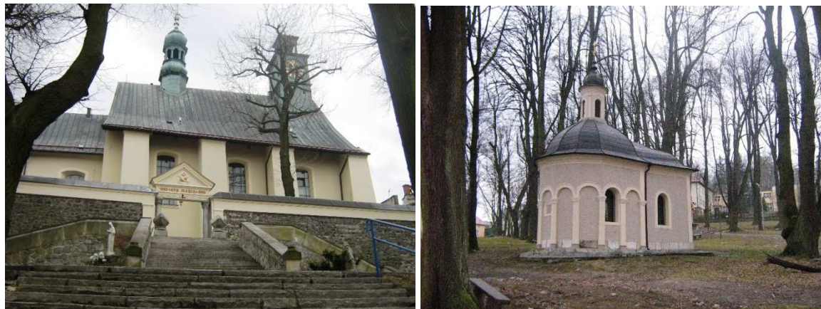
Góra Świętej Anny, bazylika św. Anny i jedna z kaplic kalwaryjskich, fot. C. Hadamik.

nazywaną „Bożą Górą Śląskiej Ziemi” lub „Śląską Perłą”, otoczoną legendami i opowieściami, których tematyka rozciąga się od przedchrześcijańskich kultów pogańskich aż po walki powstańców śląskich.