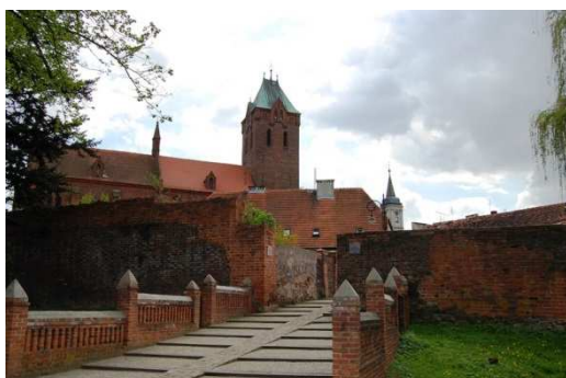
Byczyna, fortyfikacje miejskie, fot. C. Hadamik.

Z dwóch nowożytnych twierdz Śląska Opolskiego, wcześniejszą i bardziej złożoną genezę ma twierdza Nysa, której początki sięgają schyłku XVI w., kiedy powstały pierwsze fortyfikacje w systemie staroholenderskim. W połowie XVIII w., kiedy Nysa znalazła się w granicach państwa pruskiego, umocnienia zostały (na polecenie Fryderyka II) wydatnie rozbudowane (w tzw. systemie staropruskim), zastosowano w czasie tych prac rozwiązania nowatorskie, wyprzedzające ówczesną myśl fortyfikacyjną. Kolejne prace przy umacnianiu i rozbudowie twierdzy prowadzono w XIX w. Obecnie ten rozległy obszarowo obiekt jest jednym z najlepiej zachowanych reliktywów nowożytnych fortyfikacji na Śląsku. Prowadzone są prace nad jego zagospodarowaniem turystycznym. Znacznie gorszy jest stan zachowania reliktywów twierdzy Koźle, wzniesionej w zasadniczym zrębie w XVIII w., zlikwidowanej już w ostatniej ćwierci XIX stulecia. Zarysy kleszczowych umocnień widoczne są do dziś w parku miejskim, udostępnione są też dla potrzeb ruchu turystycznego nieliczne zachowane obiekty twierdzy.