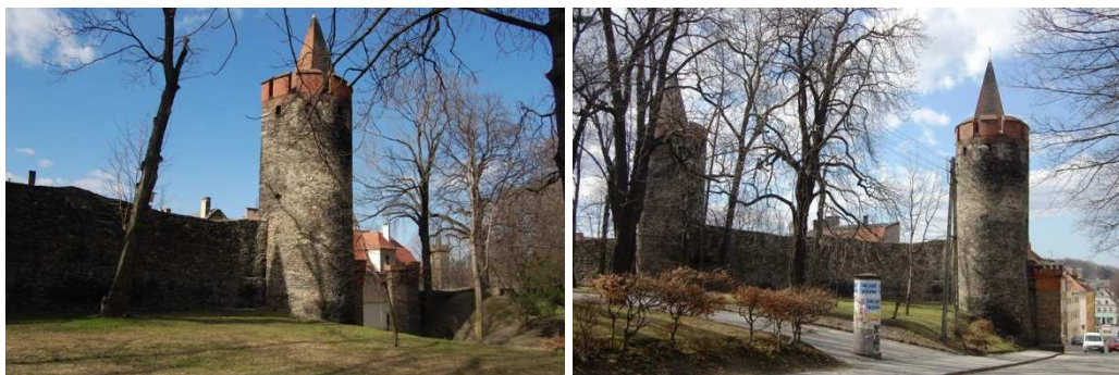
Paczków, fortyfikacje miejskie, fot. C. Hadamik.