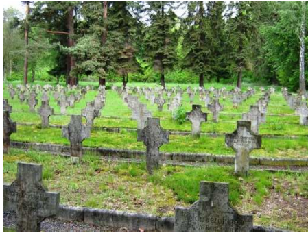
Łambinowice, Stary Cmentarz Jeniecki, fot. C. Hadamik.