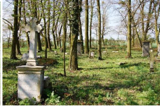
Wronów, cmentarz ewangelicki, fot. C. Hadamik.