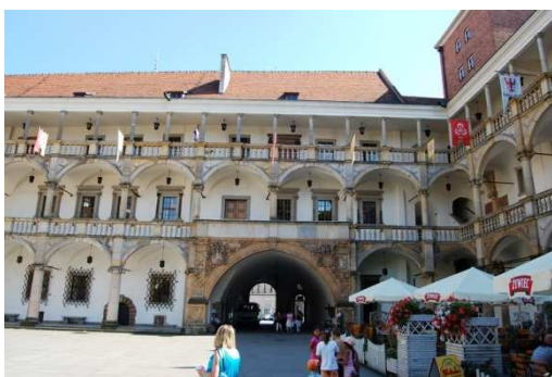
Brzeg, zamek, fot. C. Hadamik.