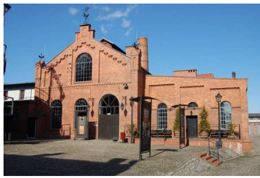
Paczków, Muzeum Gazownictwa, fot. C. Hadamik.