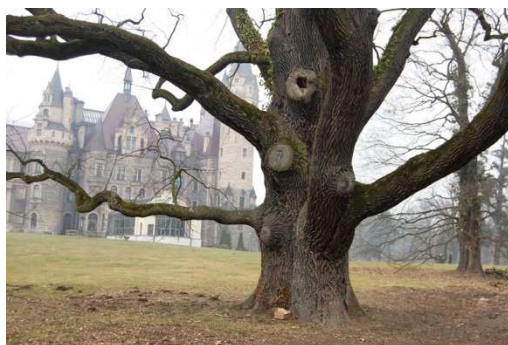
Moszna, park, fot. C. Hadamik.