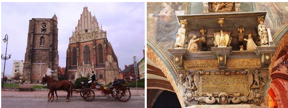
Nysa, zespół kościoła farnego pw. św. Jakuba i św. Agnieszki.

unicestwiły również otoczenie fary. Zespół jest jednak do dziś dominantą w krajobrazie miasta.