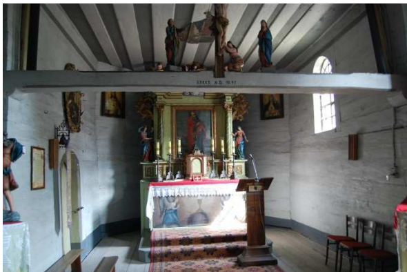
Borki Wielkie

Do zabytków ruchomych zaliczamy m.in. dzieła sztuki i rzemiosła artystycznego, zabytkowe wyposażenie obiektów sakralnych, zamków (Brzeg, Głogówek, Prószków), ratuszy (Brzeg, Otmuchów, Byczyna), jak i niekubaturowe kapliczki, malowidła ściennie, krzyże przydrożne i pokutne. Do rejestru wpisanych jest ponad 7000 zabytków. Na terenie Opolszczyzny działa 14 muzeów, które prezentują zbiory malarstwa, rzeźby, zabytków archeologicznych, numizmatycznych i innych. W Opolu działa między innymi Muzeum Diecezjalne, z bogatymi zbiorami sztuki sakralnej. W 2008 roku Muzeum Śląska Opolskiego zostało wyremontowane i rozbudowane o nową galerię wystawową. Zaadaptowało również kamieniczkę na ul. Wojciecha, urządając w niej muzeum kamienicy mieszczańskiej z pełnym wystrojem z epoki dla poszczególnych mieszkań. Oprócz muzeów miejscami skupiającymi zabytki ruchome są wnętrza obiektów sakralnych. Najliczniej prezentowane są jednolite w charakterze wyposażenia barokowe (ok. 200). Z gotyku zachowało się dużo kamiennych chrzcielnic, freski naścienne, drewniane krucyfiksy i figury świętych. Okres renesansu pozostawił wiele epitafiów, drewnianych ołtarzy, ambon i chrzcielnic.