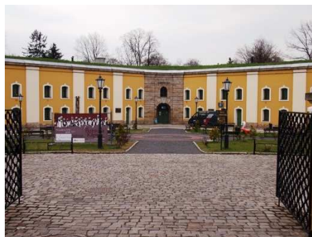
Nysa, twierdza, bastion św. Jadwigi