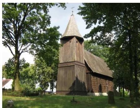
Gierałtice, kościół pw. Św. Michała Archanioła, fot. C. Hadamik.