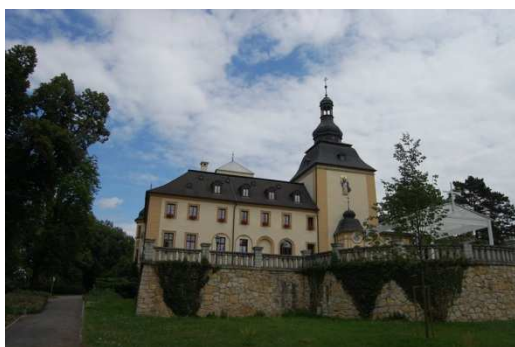
Kamień Śląski, pałac, fot C. Hadamik.

Spośród zamków reprezentacyjnym obiektem Opolszczyzny jest zespół w Brzegu (nazywany „Śląskim Wawelem”), a także niewielki, ale znaczący wizerunkowo relikwiarz średniowiecznego zamku w Opolu (Wieża Piastowska), obydwa obiekty właściwie użytkowane, w dobrym stanie, podobnie jak Górny Zamek w Opolu (regotycyzowany w XIX w.), stanowiący obecnie fragment Zespołu Szkół Mechanicznych. Wspaniały zamek książąt opolsko-niemodlińskich w Niemodlinie zmienił ostatnio właściciela i jest w trakcie prac zabezpieczających, z różnym natężeniem trwają prace w obrębie zamków w Strzelcach Opolskich i Chrzelicach. Niedawno został odzyskany przez lokalny samorząd zamek w Głogówku, co być może pozwoli na właściwe zagospodarowanie tego obiektu. Zamek w Ujeździe został zabezpieczony w formie historycznej ruiny i udostępniony dla potrzeb ruchu turystycznego. W stanie historycznej ruiny pozostaje też zamek w Krapkowicach-Otmęcie. Prace zabezpieczające przeprowadzono natomiast w obiektach w Kędzierzynie-Koźlu i Krapkowicach.