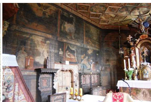
Michalice, wnętrze kościoła, fot. C. Hadamik.