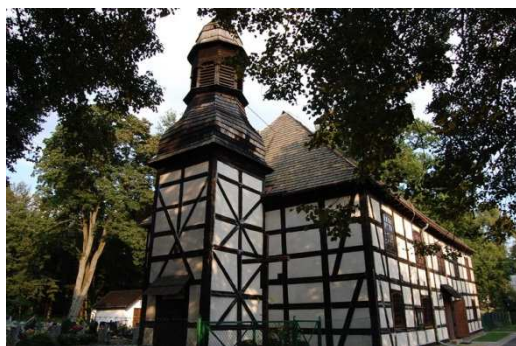
Radomierowice, kościół filialny pw. Wniebowzięcia NMP, fot. C. Hadamik.

Z czterech zachowanych na Opolszczyźnie budynków dawnych synagog (w Opolu, Praszce, Brzegu i Głogówku) dawny kształt architektoniczny zachowały neoklasycystyczny obiekt w Praszce oraz synagoga w Opolu. Ta ostatnia, gruntownie wyremontowana, mieści obecnie siedzibę TVP3 Opole.