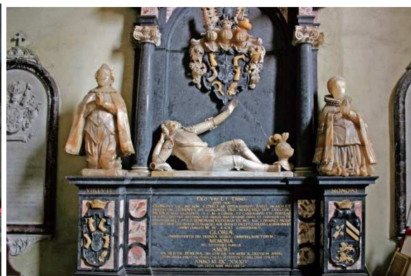
Głogówek, fot. Cz. Hadamik