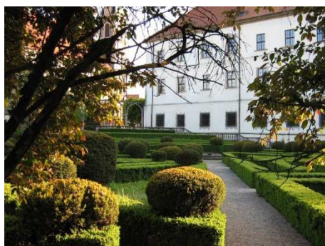
Brzeg, ogrody zamkowe, fot. C. Hadamik.

Nysa, Opole, Prudnik, Strzelce Opolskie, Kędzierzyn-Koźle, Paczków, Głubczyce), ogrody i zespoły zieleni komponowanej. Stan parków pałacowych i dworskich jest prostą pochodną zagospodarowania obiektów architektury. Stan publicznych przestrzeni zieleni jest na ogół dobry, podobnie jak zespołów komponowanej zieleni (np. na Górze Świętej Anny). Jako obiekt wyjątkowy trzeba traktować park-arboretum w Prószkowie, kontynuujący tradycję XIX-wiecznego pruskiego Królewskiego Instytutu Pomologicznego, który właśnie w Prószkowie miał swoją siedzibę. Wizytówką regionu jest też park w Pokoju, dobrze zachowane założenie z XVIII w. (ogród francuski) i XIX w. (park krajobrazowy) o unikalnych wartościach kompozycyjnych i artystycznych.