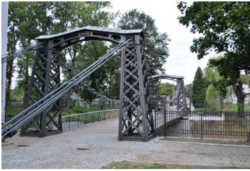
Ozimek, most żelwny, fot. C. Hadamik.