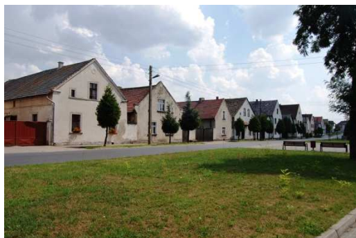
Jemielnica, układ ruralistyczny, zabudowa pierzei ulicy wiejskiej, fot. C. Hadamik.

(Pokój) lub rzędówka brzegowa o dwóch równoległych drogach wzdłuż płynącego środkiem potoku (Grobniki, Łąka Prudnicka, Grodziec). W wielu wsiach zachowane są też charakterystyczne dla różnych rejonów Opolszczyzny rozplanowania zagród, a także ulice wiejskie z gęstą zabudową złożoną z domów ustawionych szczytami do ulicy. Cztery układy ruralistyczne zostały w latach 50. i 60. wpisane do rejestru zabytków (Grobniki, Jemielnica, Ścinawa Nyska i Pilszcz, wobec którego prowadzona jest procedura skreślenia z rejestru). Powołany przez Wojewodę Opolskiego zespół, który w latach 2008-2010 prowadził waloryzację zabytkowego zasobu wsi w granicach regionu, ocenił na podstawie szeregu przyjętych kryteriów, że 53 wsie Opolszczyzny mają wybitne, bardzo wysokie oraz wysokie walory zasobu kulturowego. Wśród nich do najcenniejszych zaliczono: Stary Paczków, Złotogłowice, Klisino, Jemielnicę, Strzeleczyki, Różynę i Raławice Śląskie.