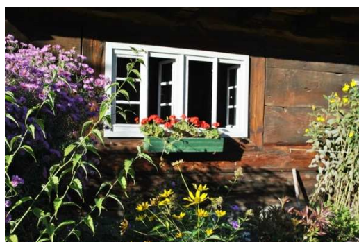
Opole, Muzeum Wsi Opolskiej, fot. C. Hadamik.

w Mosznej. Już obecnie jest to jeden z najbardziej rozpoznawalnych obiektów Opolszczyzny, który może być zarówno scenerią najwyższej rangi wydarzeń kulturalnych, znakomitym planem teatralnym, filmowym i telewizyjnym, jak również miejscem międzynarodowych rokowań, negocjacji i konferencji na wysokim szczeblu, nic przy tym nie tracąc z walorów bardziej lokalnego ośrodka kultury. Inne obiekty, które można wykorzystać do prowadzenia działań promujących dziedzictwo regionu to Ostrówek w Opolu, zamek w Brzegu, zespół zamkowo-parkowy w Rogowie Opolskim, park w Pokoju, Góra Świętej Anny, a także rynki miast historycznych, takich jak Opole, Nysa, Brzeg, Paczków, Głubczyce i inne. Wszystkie te obiekty i przestrzenie umożliwiają tworzenie ofert tematycznych, skierowanych w stronę turysty bardziej wybrednego, miłośnika i znawcy sztuki i kultury wysokiej (wystawy, koncerty, cykliczne konkursy i festiwale), który będzie skłonny spędzić więcej czasu, aby głębiej wniknąć w atmosferę miejsc, które zobaczy tylko tutaj. Rynki miejskie można wykorzystać w celach promocyjnych, jako przestrzenie wystawiennicze, oraz informacyjnych (dotyczących wydarzeń związanych z szeroko pojętym dziedzictwem kulturowym).