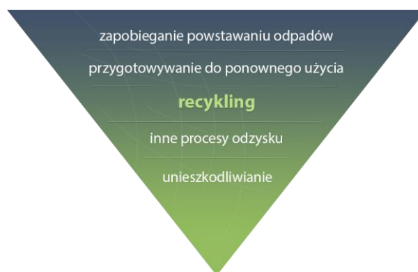
Rysunek nr 1 Hierarchia postępowania z odpadami

Dyrektywa określa hierarchię postępowania z odpadami, wskazując jako najbardziej preferowany kierunek zapobieganie powstawaniu odpadów, a gdy nie uda się zapobiec powstaniu odpadów należy przygotować je do ponownego użycia i recyklingu. Przepisy dyrektywy zostały przetransponowane do przepisów krajowych, w związku z czym w ustawie o odpadach została ustanowiona poniżej przedstawiona hierarchia postępowania z odpadami.