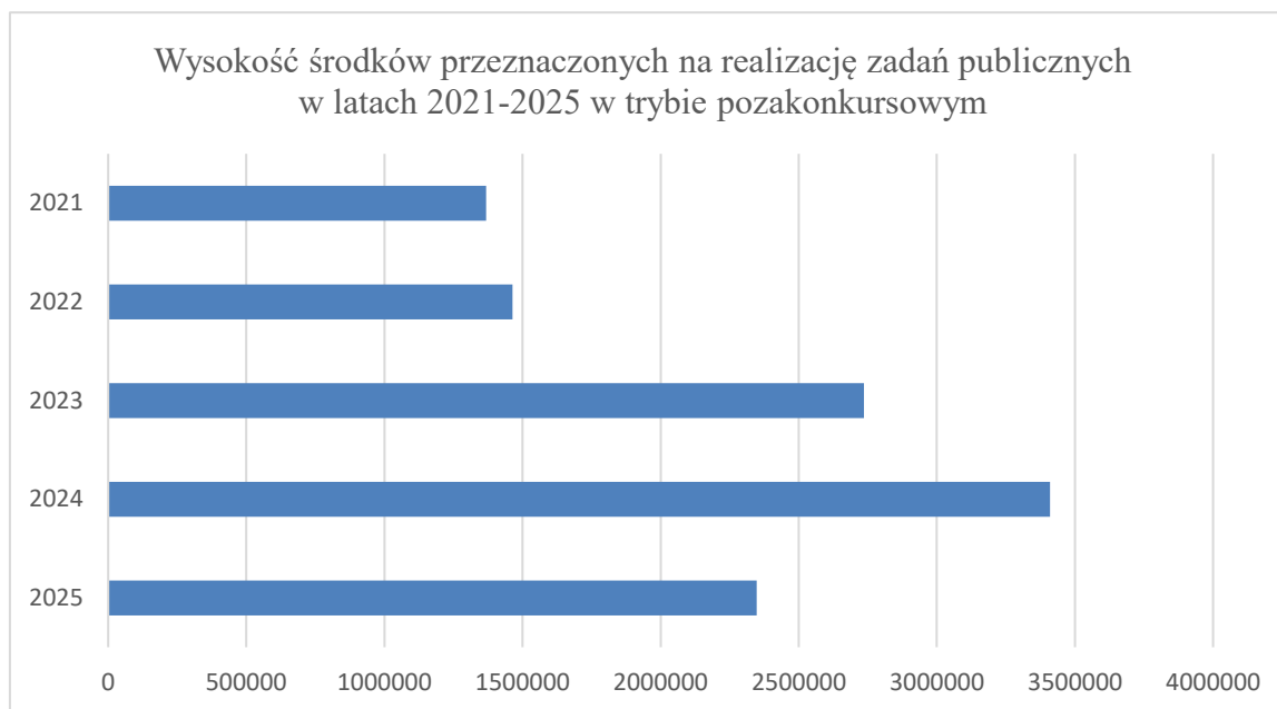
Rysunek 2 Wysokość środków przeznaczonych na realizację zadań w latach 2021-2025 w ramach trybu pozakonkursowego

Podsumowując, w latach 2021-2025 Samorząd Województwa Opolskiego przekazał na realizację Programu w ramach współpracy finansowej łączną kwotę: 119 853 133,77 zł.