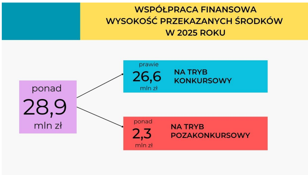
Wykres 1: Składowe środków przekazanych na realizację Programu w 2025 roku

Porównując wydatkowanie z 2024 rokiem, w którym przekazano dla Podmiotów Programu kwotę 27 821 520,45 zł, wysokość współpracy finansowej w roku 2025 jest większa o 1 104 288,55 zł. Powyższe oznacza, że na realizację Programu w 2025 r. przeznaczono prawie 4% więcej środków w stosunku do roku 2024. Można ponadto zauważyć, że zwiększone zostały m.in. środki na Konkursy o prawie 9%. Zwiększenie nakładów finansowych Samorządu na rzecz Podmiotów Programu wynika z coraz większej roli, jaką pełnią organizacje pozarządowe w regionie, angażując się w rozwijanie społeczności lokalnych oraz wzrost aktywności mieszkańców województwa. Organizacje pozarządowe aktywnie uczestniczyły w inicjatywach Samorządu, wykazując duże zaangażowanie w realizację projektów, co świadczy o rosnącej świadomości i zainteresowaniu współpracą.