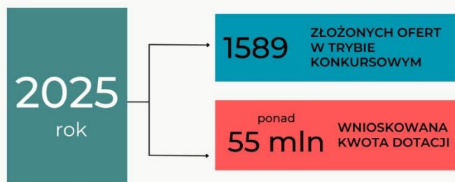
Wykres 3: Oferty złożone w trybie konkursowym

Konkursy ogłaszane były zgodnie z założeniami Programu oraz przyjętym Harmonogramem na 2025 rok.