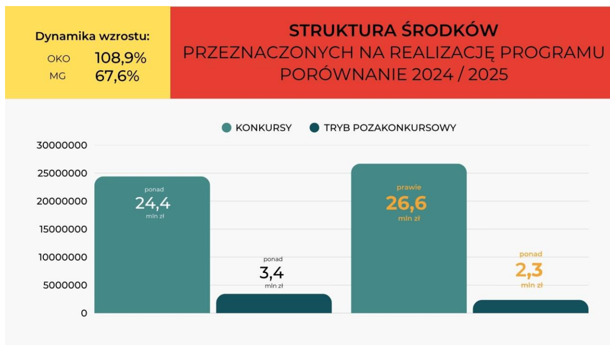
Wykres 4: Struktura środków przeznaczonych na realizację Programu. Porównanie 2024 i 2025 roku.

W 2025 roku, w porównaniu do roku poprzedniego, większa pula środków została przekazana Podmiotom Programu w trybie konkursowym, co świadczy o rosnącym znaczeniu Konkursów jako podstawowego mechanizmu dystrybucji środków publicznych, czego celem jest zapewnienie równego dostępu do finansowania oraz podnoszenie jakości realizowanych zadań publicznych.