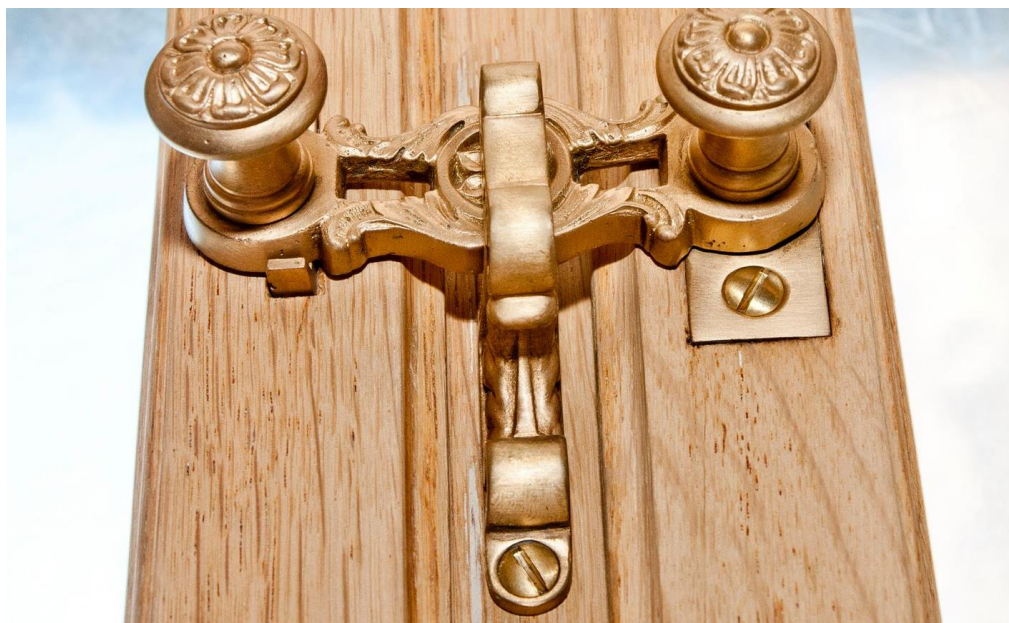
Mechanismy poddane renowacji