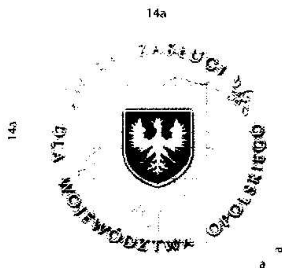
Wersja czarno biała skala 1:1